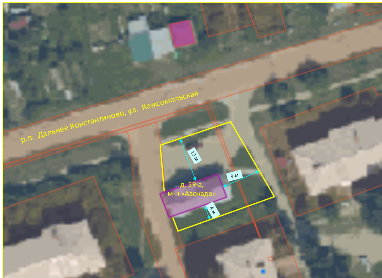
Схема границ прилегающих территорий