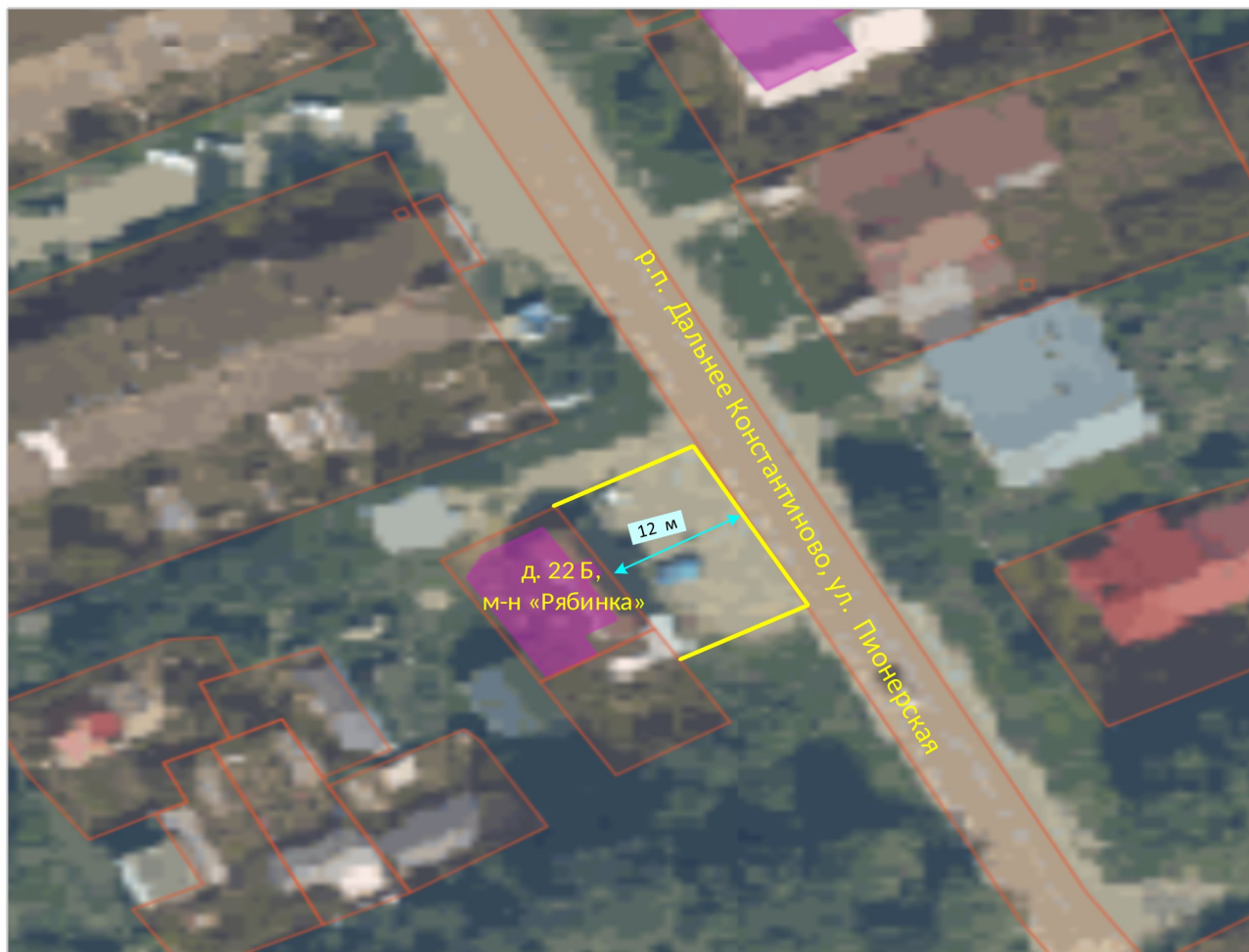
Схема границ прилегающих территорий

Приложение 11 к постановлению администрации Дальнеконстантиновского муниципального округа № от 19.01.2026 73