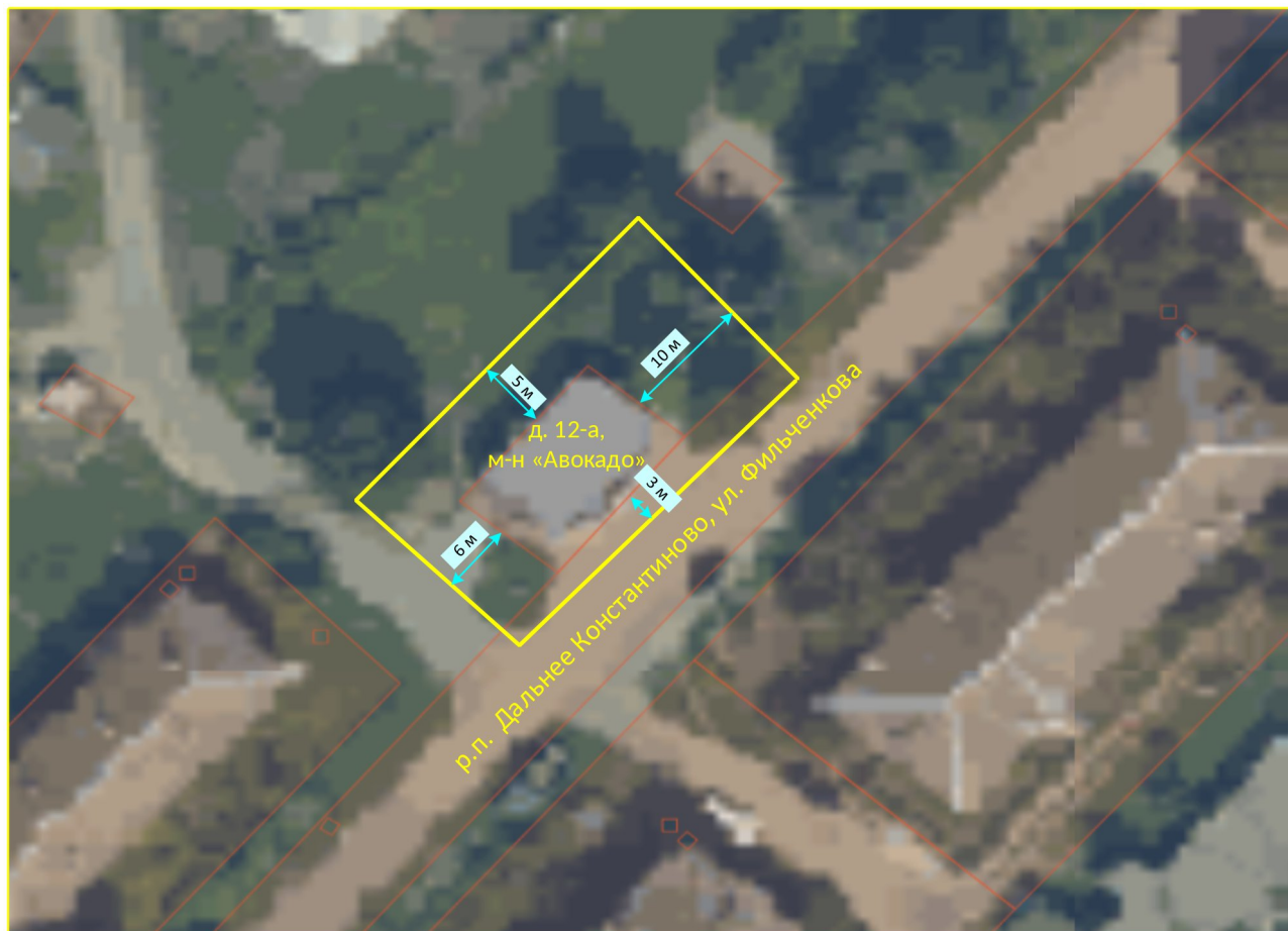
Схема границ прилегающих территорий

Приложение 12 к постановлению администрации Дальнеконстантиновского муниципального округа № от 19.01.2026 73