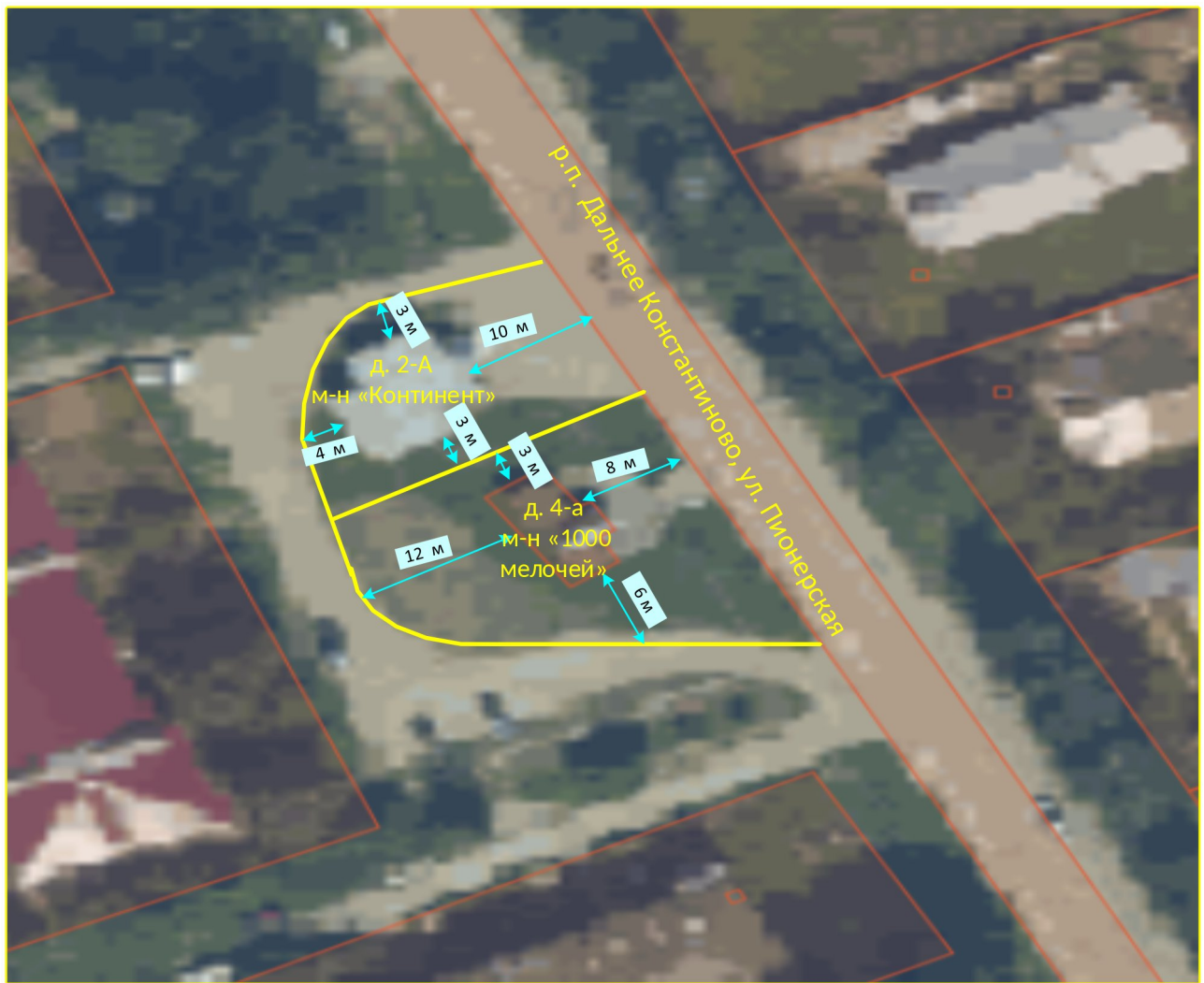
Схема границ прилегающих территорий

Приложение 10 к постановлению администрации Дальнеконстантиновского муниципального округа № от 19.01.2026 73