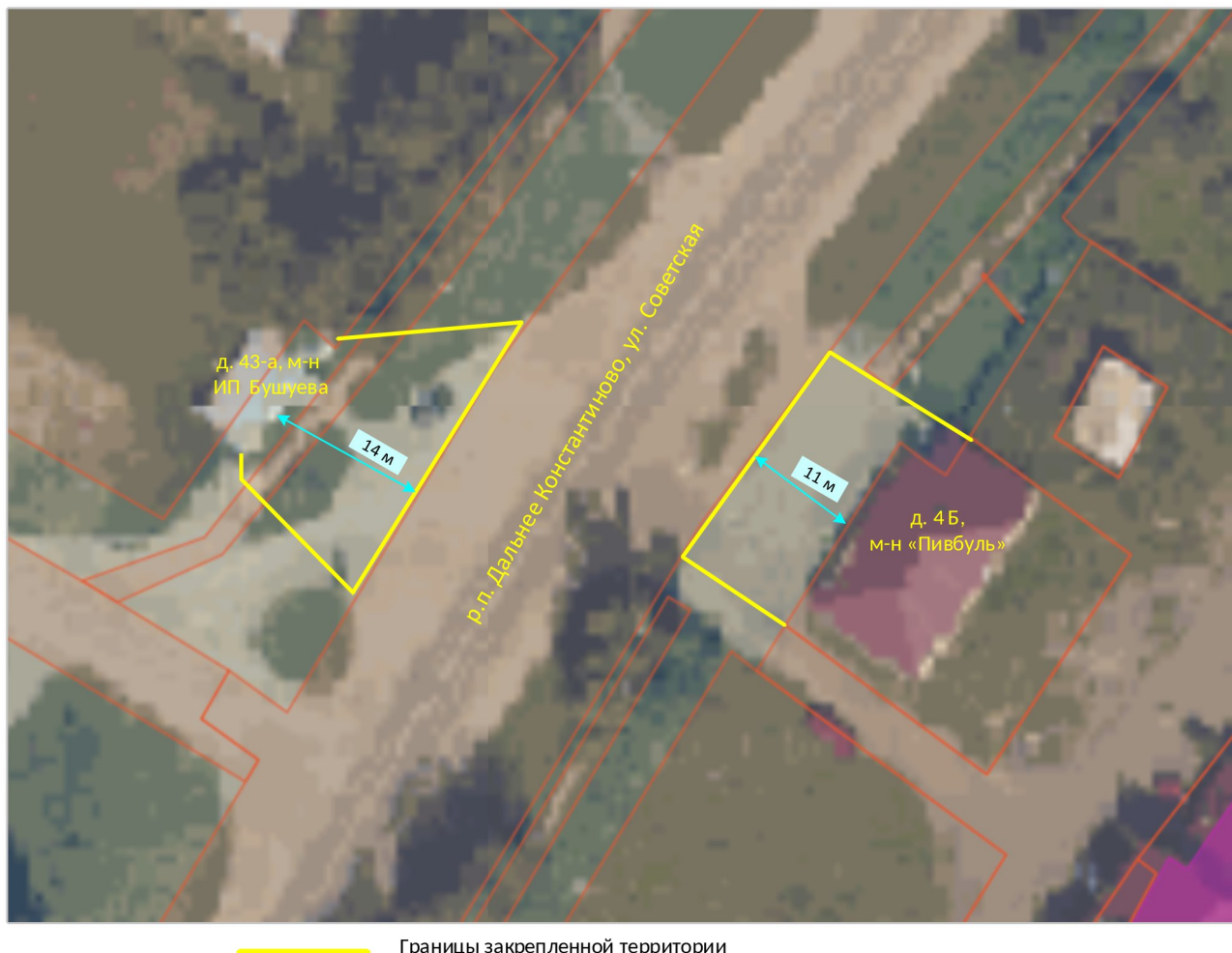
Схема границ прилегающих территорий

Приложение 1 к постановлению администрации Дальнеконстантиновского муниципального округа № 19.01.2026 от 73