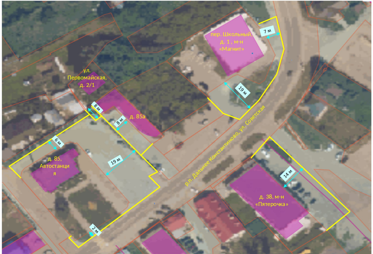
Схема границ прилегающих территорий