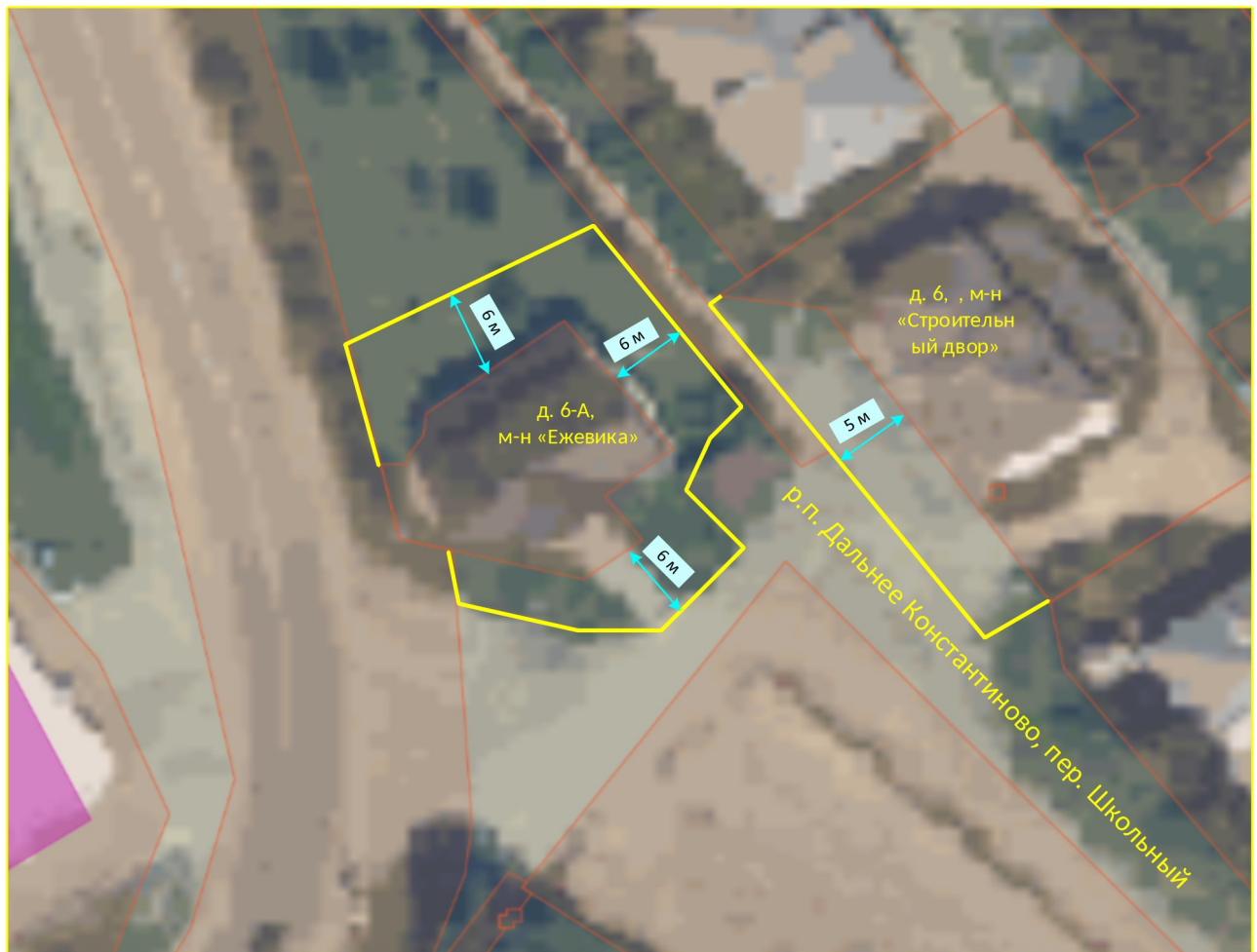
Схема границ прилегающих территорий

Приложение 13 к постановлению администрации Дальнеконстантиновского муниципального округа № 19.01.2026 от 73