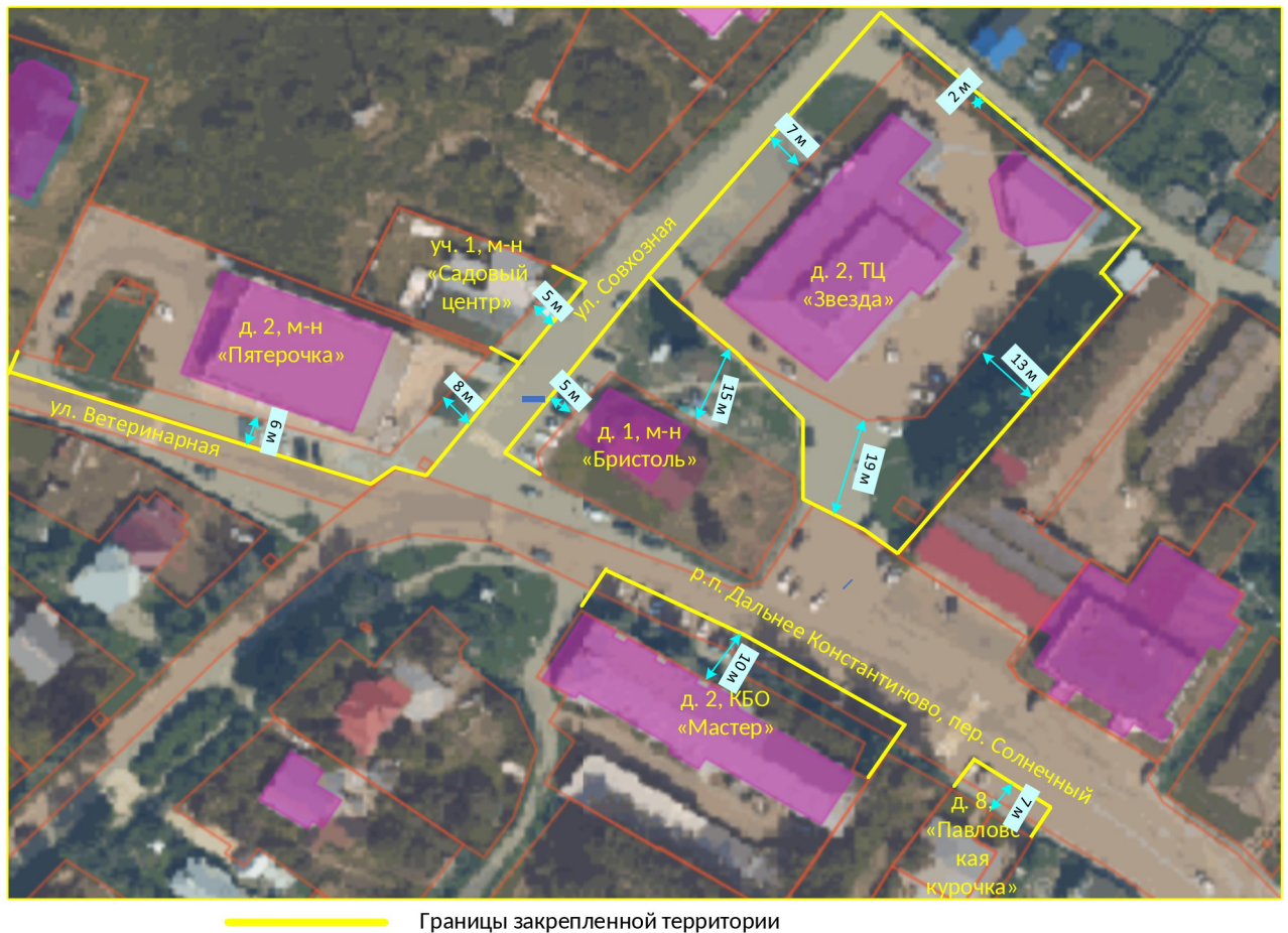
Схема границ прилегающих территорий

Приложение 8 к постановлению администрации Дальнеконстантиновского муниципального округа № от 19.01.2026 73