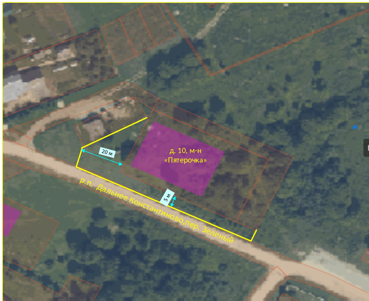
Схема границ прилегающих территорий

Приложение 9 к постановлению администрации Дальнеконстантиновского муниципального округа № от 19.01.2026 73