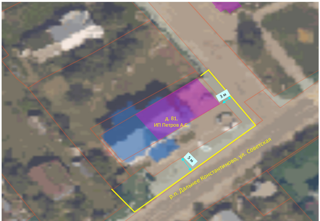
Схема границ прилегающих территорий

Приложение 2 к постановлению администрации Дальнеконстантиновского муниципального округа № 19.01.2026 от 73