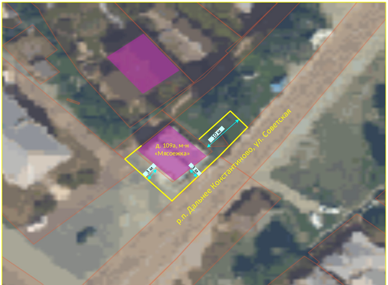
Схема границ прилегающих территорий