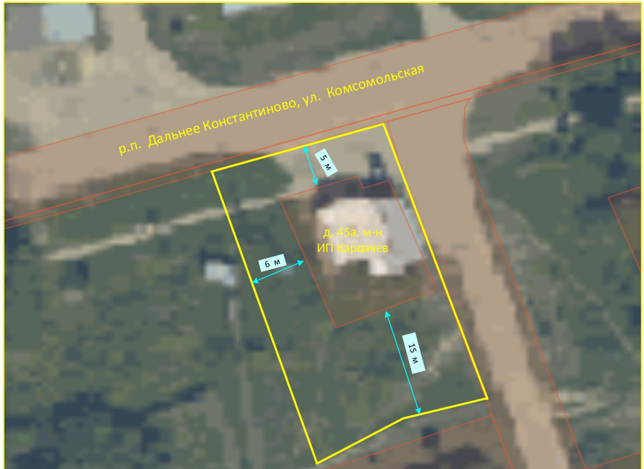
Схема границ прилегающих территорий