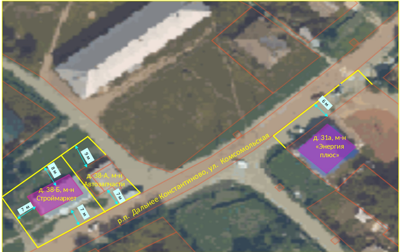
Схема границ прилегающих территорий

Приложение 5 к постановлению администрации Дальнеконстантиновского муниципального округа № 19.01.2026 от 73